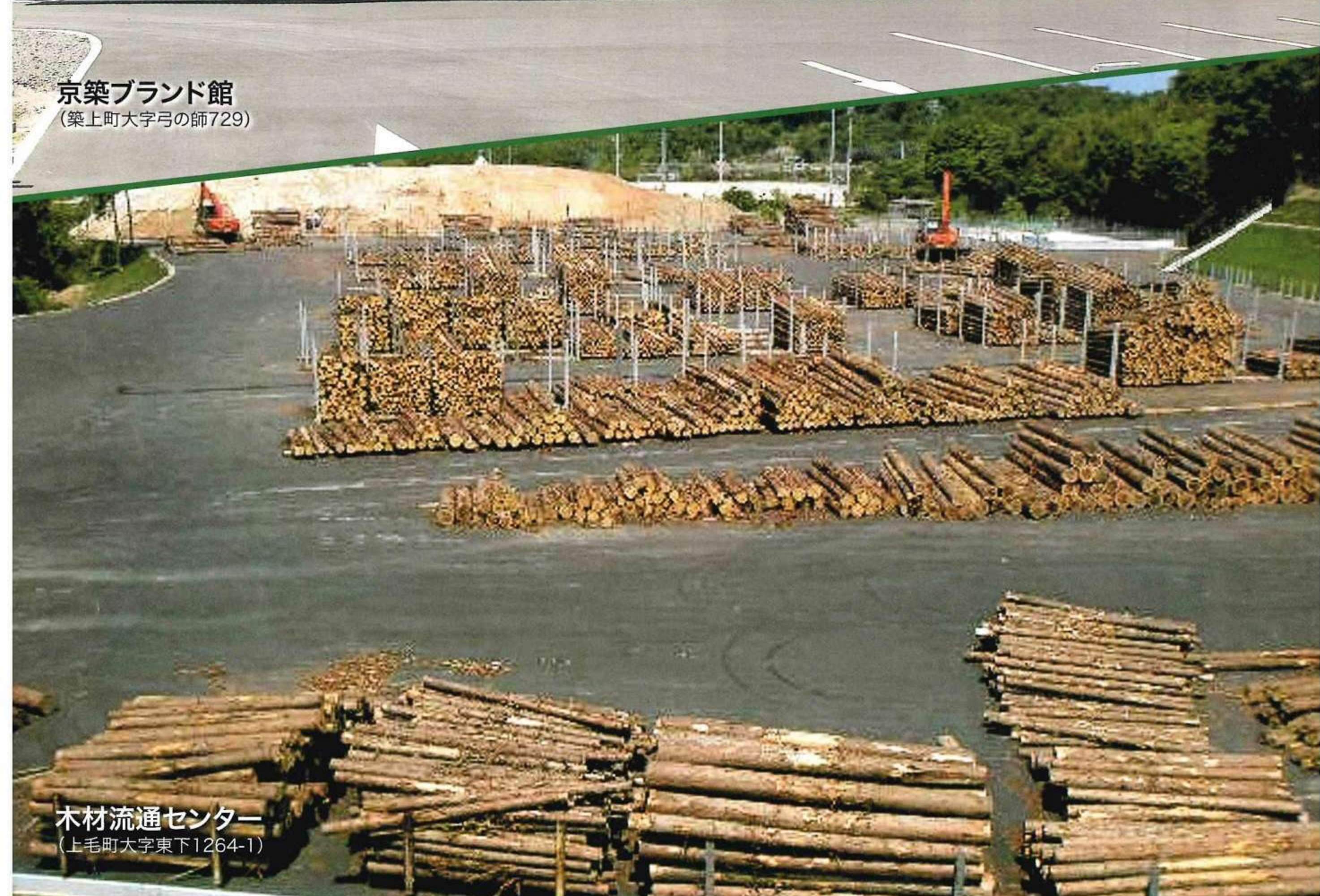
木材流通センター (上毛町大字東下1264-1)