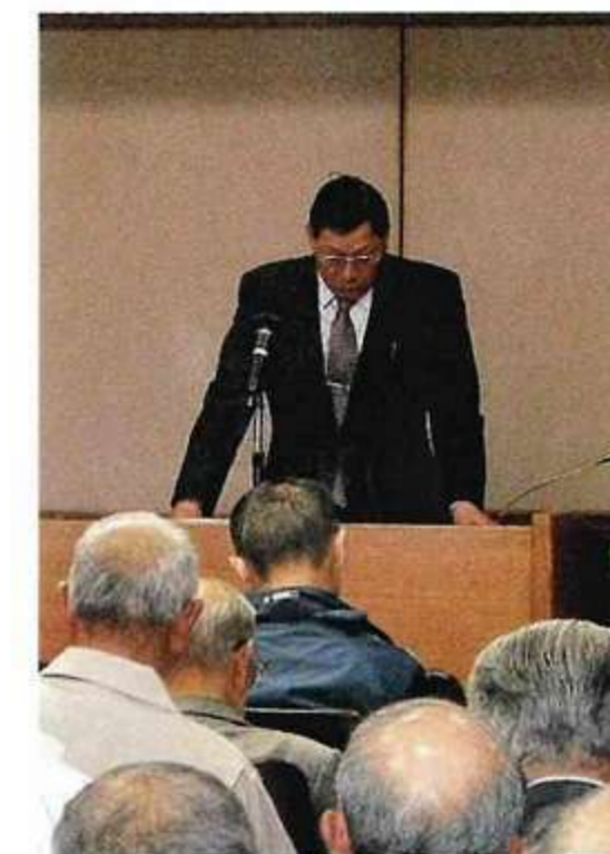
挨拶する大山組合長