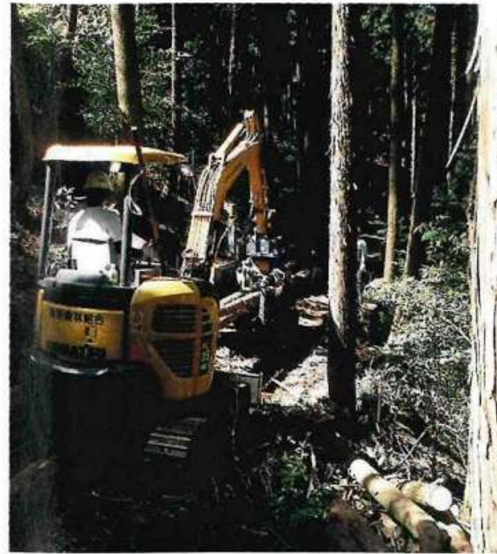
▲搬出間伐作業の様子