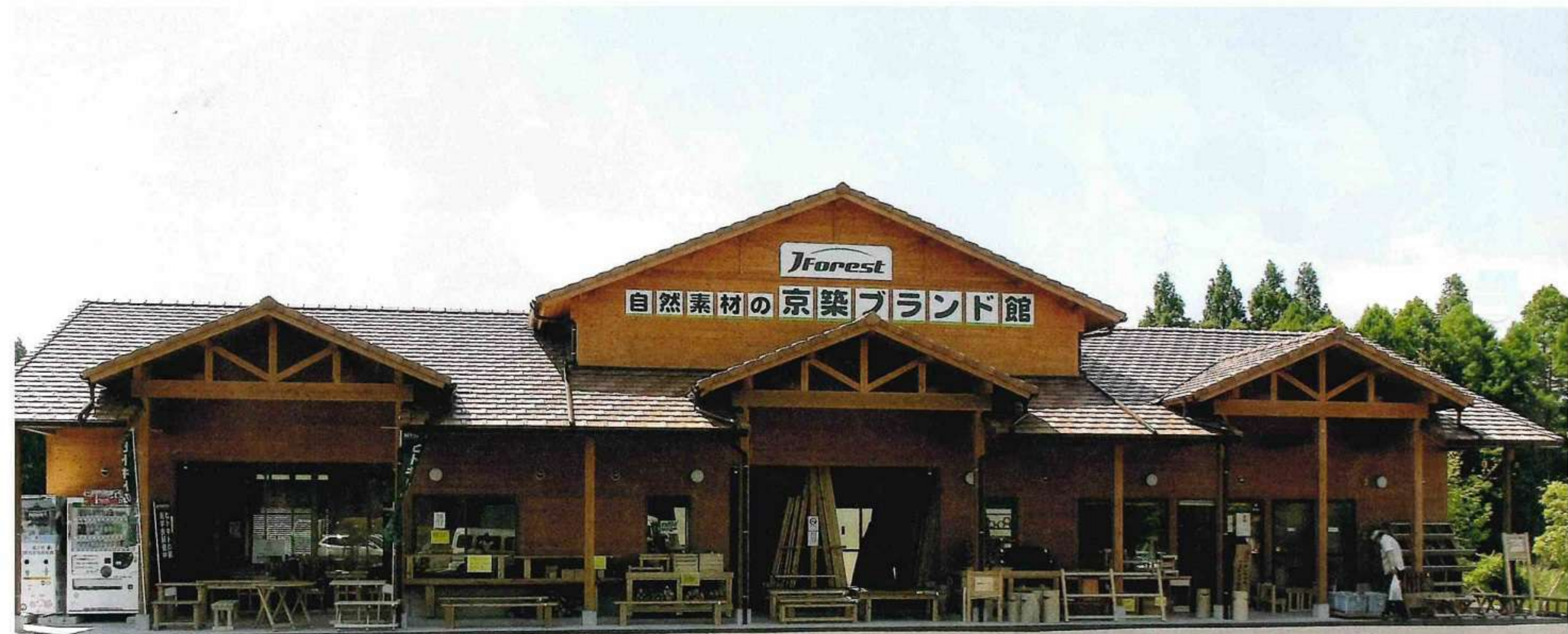
京築ブランド館 (築上町大字弓の師729)