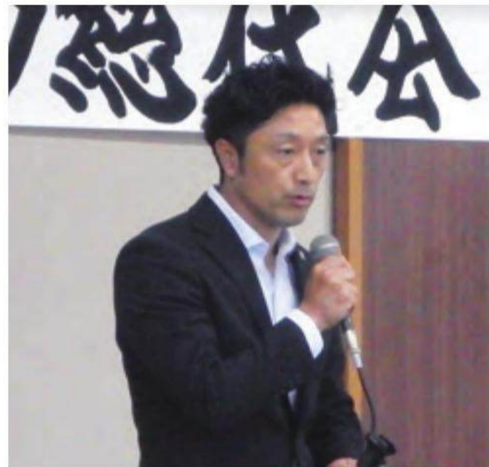
来賓祝辞 福岡県議会議員 戸成 祥平様