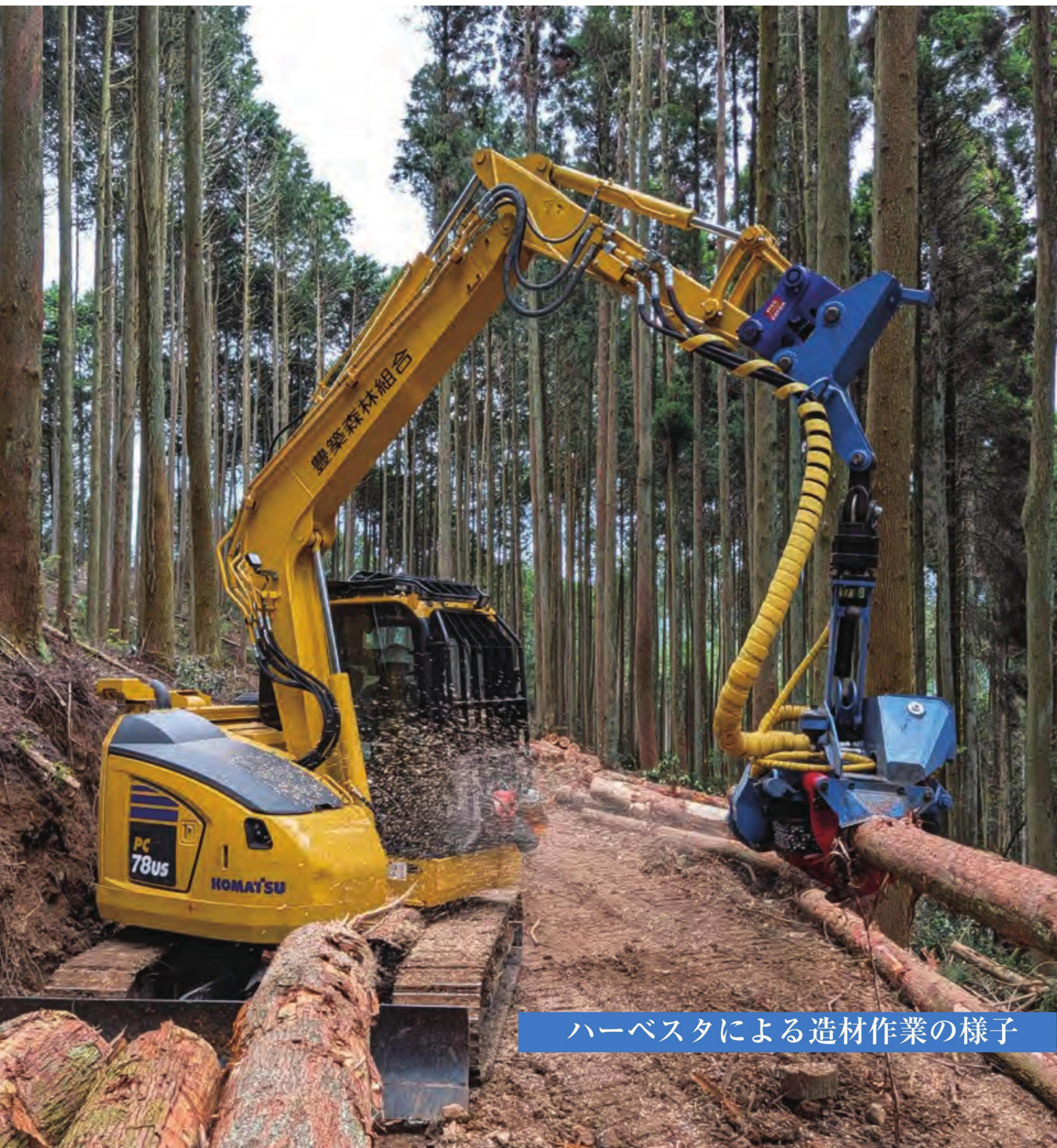
ハーベスタによる造材作業の様子