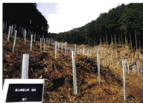
森林組合施工 植栽及び獣害対策モデル

少しでも費用負担を少なくできるようにアドバイザーいたします。 山林売買を検討される場合は、伐採する前にご相談ください。