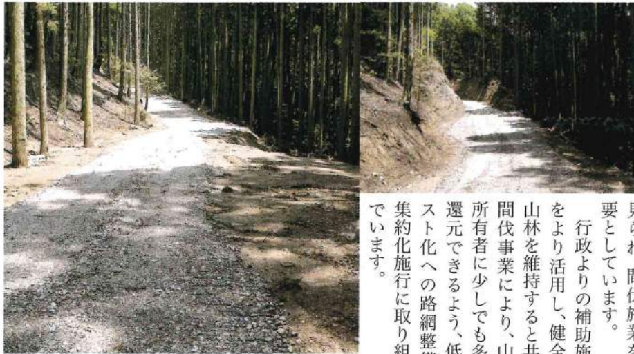
寒田地区焼岩作業道完成(幅員3m)延長約1000m