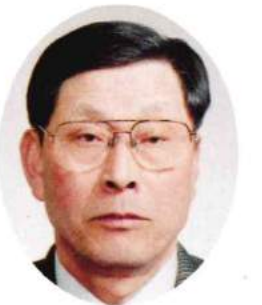
豊築森林組合代表理事 組合長