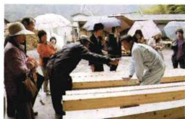
製材所見学の様子