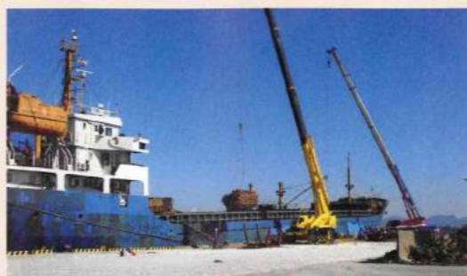
○丸太積み込みの様子(中津港) 約2500m 3 を積み込み、中国上海港へと輸出します