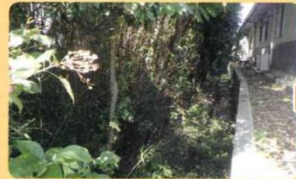
木が生い茂って薄暗い 日が当たらないからジメジメしている など