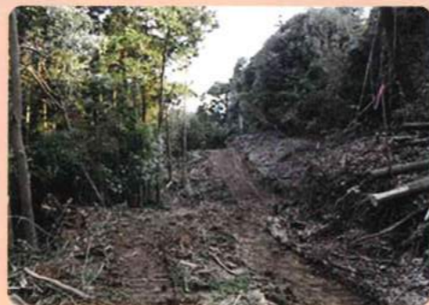
作業道開設【施工前】