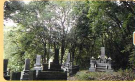
台風で木が倒れないか心配 落ち葉で掃除が大変 など