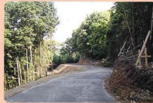
作業道開設【施工後】