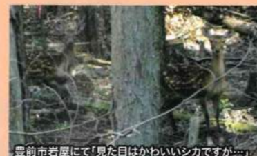
豊前市岩屋にて「見た目はかわいいシカですが…」

山林にスギやヒノキを植栽しても鹿やウサギの害で木が大きく育ちません。木を育てて行くためには獣害対策が必須となっています。