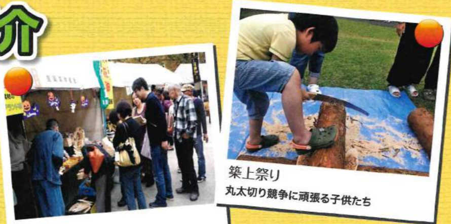
築上祭り 丸太切り競争に頑張る子供たち

今年度も多くのイベントに参加しました。木材や木製品の良さを地域や都市部の皆様にPRしています。各イベントの様をお知らせいたします。