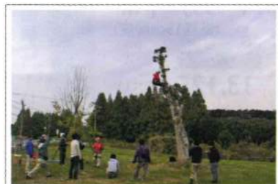
11月4日 ヒトキトツーリズム2