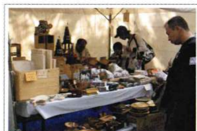
10月27・28日 ふうおか町村フェア