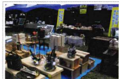
10月6・7日 ウッドフェスタ