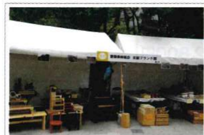
10月6日 京築フェスタ